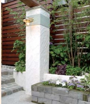
築34年の住宅との調和に配慮し、門柱の灯りは真ちゅう製の船舶ライトを採用。

ひときわ印象的な丸太を用いた門まわり。古民家に使われていた古木を採用。花台としても活躍するベンチも設け、訪れる人を優しく迎えます。