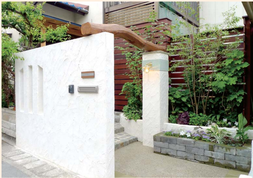
ヨーロッパの石置に使われていたブロックや長城レンガをさりげなく採用。時を重ねるにつれて趣を増してゆきます。