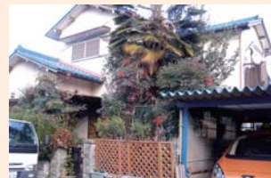
リフォーム前 築34年の住宅の玄関まわり。木々が育ち重く暗い印象です。