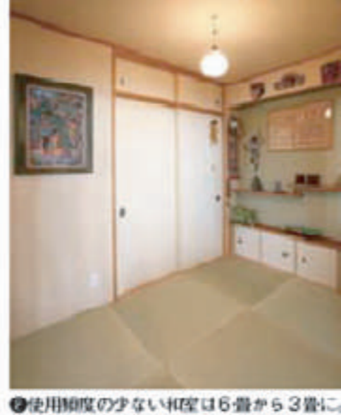
●使用頻度の少ない4LDKは6畳から3畳に。緑なし畳の市松敷きでモダンなイメージに

本誌掲載の広告内容が事実と異なる場合は読者ホットライン☎0120-305-444まで