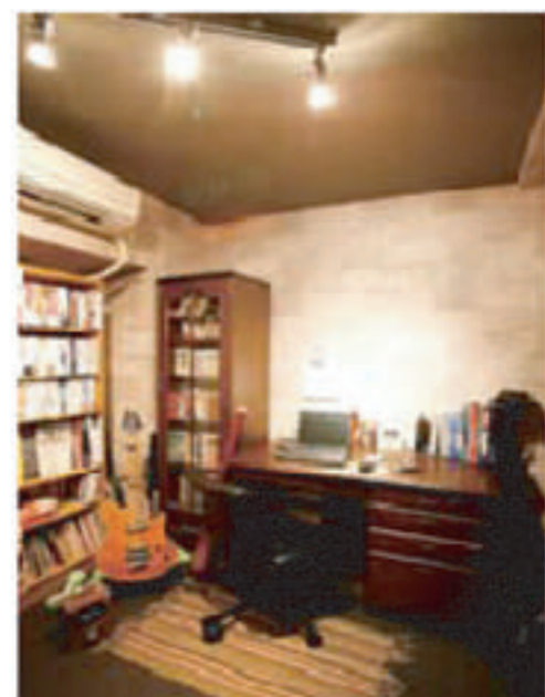
●夫こだわりの書斎。壁は石調。天井と床はダークな色で穴蔵のような雰囲気に