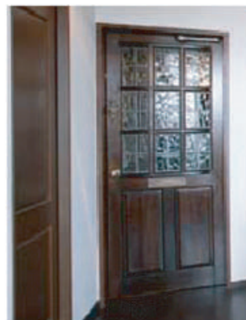
●Nさんこだわりのリビングドア。共に選んだ本物のアンティークをメンテナンス