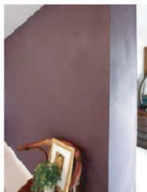
●寝室の壁にはパープルのポーターズペイントを。壁の裏はウォークインクローゼット