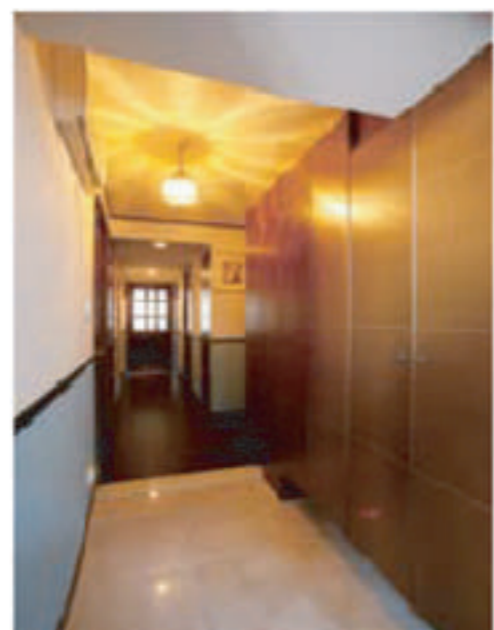
●アンティーク照明の光が幻想的な玄関。壁はクロスにペイントして塗り壁風に